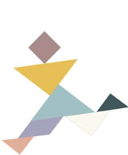
Bonhomme qui court vite