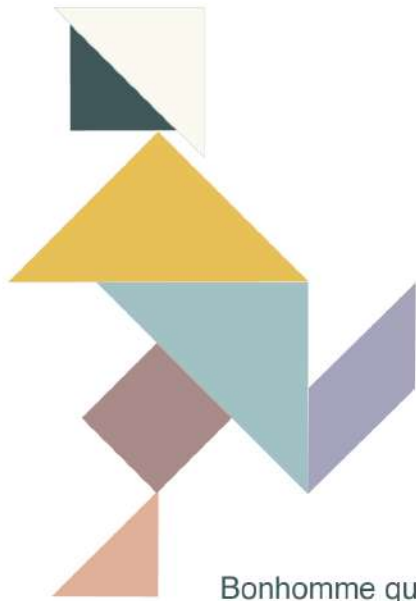
Bonhomme qui court