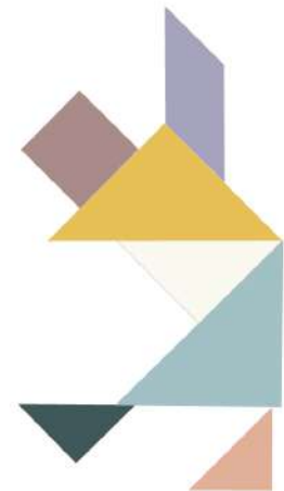
Bonhomme qui fait la révérence