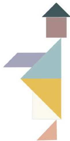
Bonhomme qui tend la main